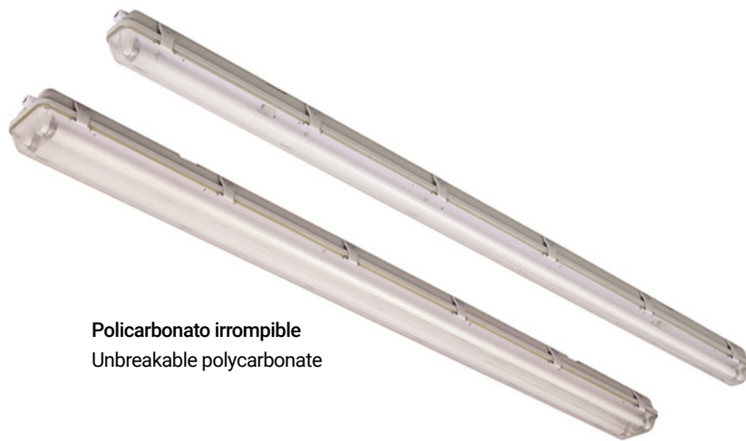
Policarbonato irrompible Unbreakable polycarbonate